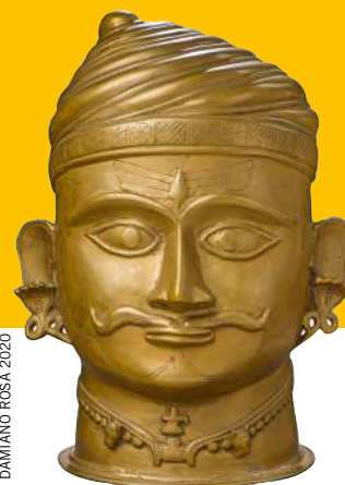
DAMIANO ROSA 2020